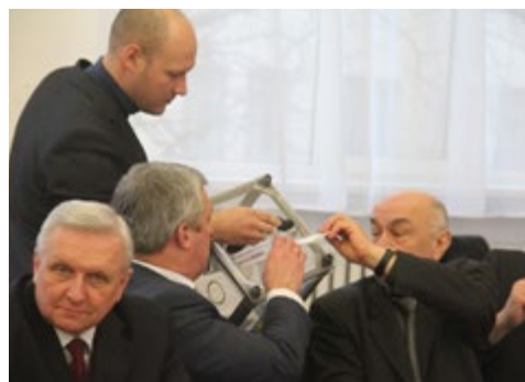
Момент таємного голосування стосовно кандидатур від Університету на здобуття премії ВРУ та на отримання стипендії КМУ